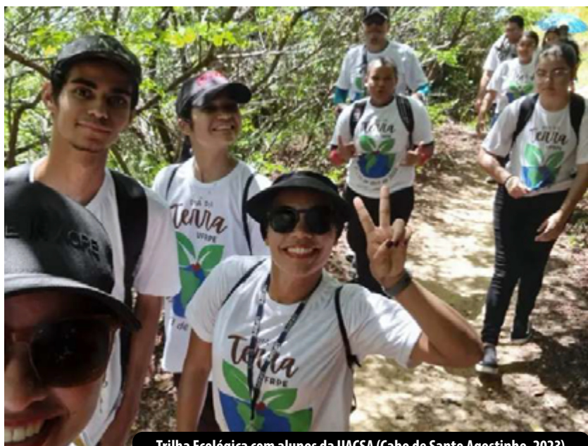
Trilha Ecológica com alunos da UACSA (Cabo de Santo Agostinho, 2023)