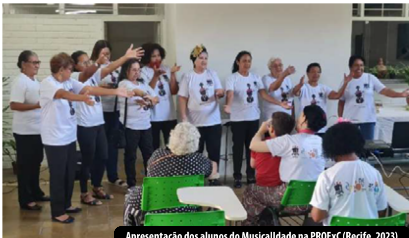
Apresentação dos alunos do Musicalidade na PROExC (Recife, 2023)

O Projeto de Extensão MusicalIDADE foi criado em 2022 pela PROExC em parceria com o Núcleo de Envelhecimento Humano da UFRPE e tem a finalidade de melhorar a saúde e qualidade de vida de pessoas idosas por meio do canto. Os participantes com idade igual ou superior a 60 anos são servidores da Universidade e pessoas residentes na Região Metropolitana de Recife. A equipe pedagógica do Projeto é formada por estudantes, professores e técnicos da UFRPE, que dão apoio aos participantes no desenvolvimento de atividades multidisciplinares, tais como: dinâmicas de integração, workshops, eventos, apresentações culturais, palestras e oficinas temáticas.