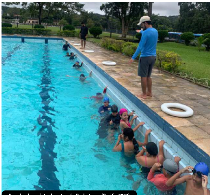
As aulas do projeto de extensão Barbatanas (Recife, 2023)