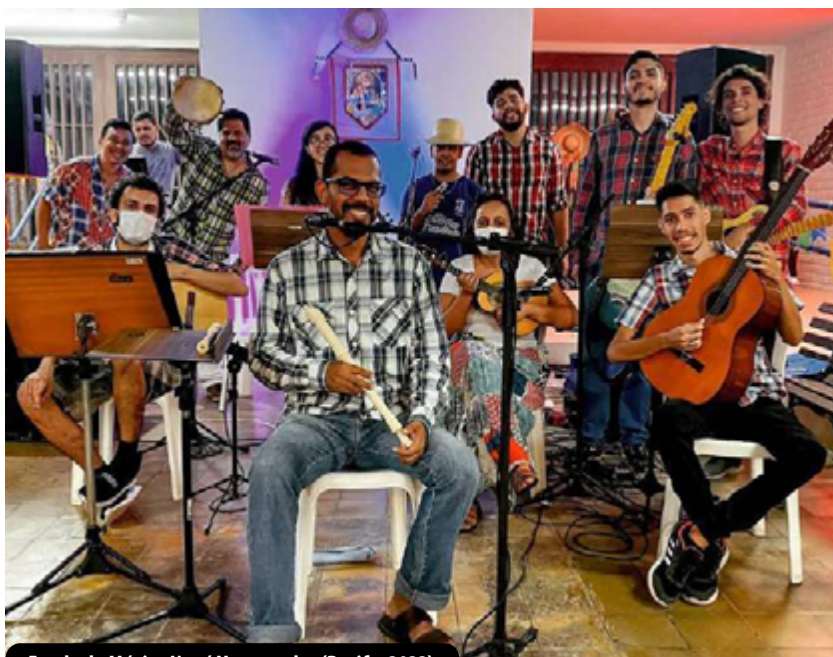
Escola de Música Naná Vasconcelos (Recife, 2023)

No período pós-pandemia da Covid-19, a Escola ressurgiu com uma nova configuração, sendo reestruturada e requalificada, ampliando possibilidades de oferta de vagas para a comunidade acadêmica, assim como de atuação em eventos científicos e culturais promovidos por diversos setores da Universidade. Atualmente, o potencial musical da Escola mobiliza jovens discentes para descobrirem habilidades artísticas e se engajarem em projetos culturais realizados na UFRPE e na sociedade.