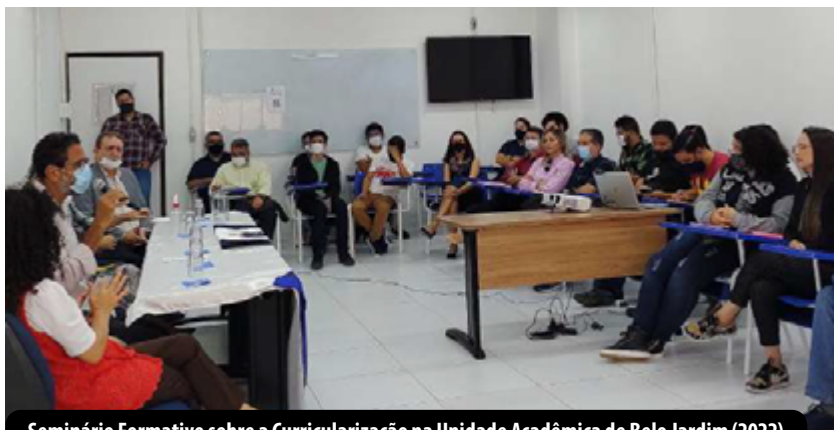
Seminário Formativo sobre a Curricularização na Unidade Acadêmica de Belo Jardim (2022)

O Plano de Ação da Comissão foi composto por atividades realizadas no período de 2021 a 2024 de acordo com as seguintes fases: formação, proposição, implementação e acompanhamento. Estas fases incluíram a realização de três ciclos formativos compostos por seminários realizados de forma descentralizada (SEDE e nas Unidades Acadêmicas), os quais tiveram como finalidade apresentar e debater propostas, experiências e documentos sobre a curricularização. Simultaneamente à realização dos seminários, os documentos citados, a seguir, foram colocados em consulta pública por meio dos canais de comunicação da Universidade para acolher sugestões e ampliar a participação da comunidade acadêmica.