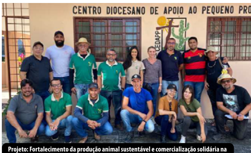
Projeto: Fortalecimento da produção animal sustentável e comercialização solidária na agricultura familiar do Agreste Pernambuco. (Pesqueira, 2022)

No cenário de retorno às atividades presenciais, a partir de 2021, a PROExC, em parceria com a Casa da Mulher do Nordeste (CMNE) e a Federação dos Trabalhadores Rurais, Agricultores e Agricultoras do Estado de Pernambuco (FETAPE), lançou o Edital EDITAL Nº 04/2021 – SÔNUS/CMNE/FETAPE 2021, para atender as demandas de formação educativa, técnica e política de grupos de mulheres e jovens no campo e na cidade, em cinco territórios do Estado de Pernambuco. Esse edital apoiou cinco programas, cada um com três projetos, durante trinta meses.