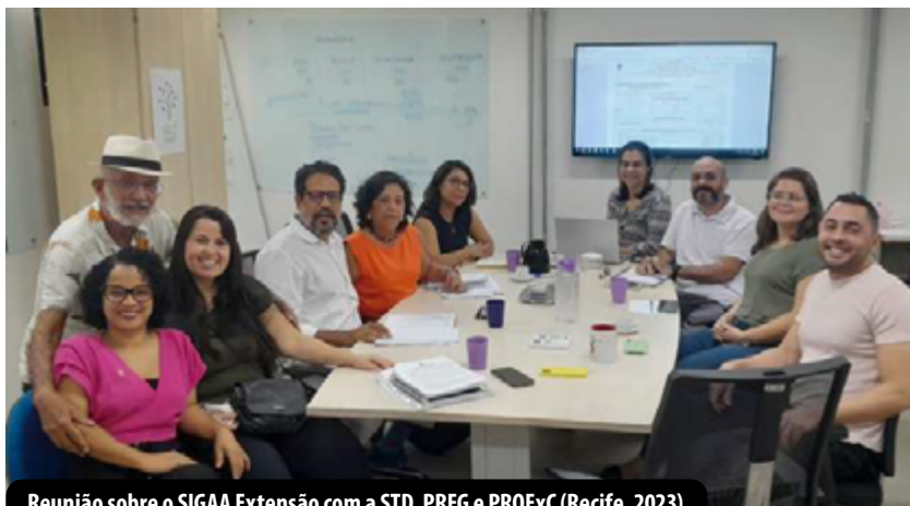
Reunião sobre o SIGAA Extensão com a STD, PREG e PROExC (Recife, 2023)

Com o intuito de dar continuidade a implementação da Curricularização na UFRPE, a reitoria criou a Comissão Institucional da Curricularização (CIC). A criação desta está em conformidade com a Resolução N°. 552/2022, no seu Art. 3º, que estabelece que a referida Comissão tem como objetivo orientar e acompanhar a implementação das Atividades Curriculares de Extensão (ACE) na UFRPE e trabalhará em sintonia com a Secretaria de Tecnologias Digitais (STD) para implantação do SIGAA - Extensão.