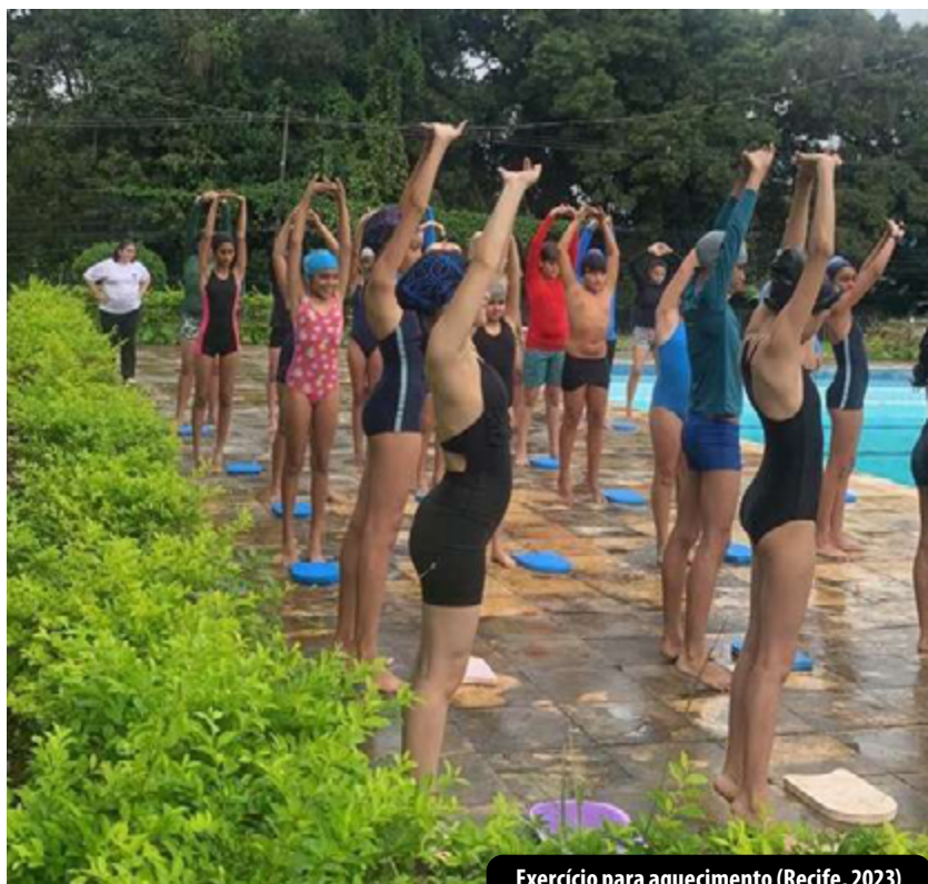
Exercício para aquecimento (Recife, 2023)

O Projeto possibilita também a participação de estudantes em competições no estado de Pernambuco, resultando na conquista de medalhas. Os pais dos estudantes do BARBATANAS reconhecem o impacto educativo do projeto e o cumprimento da função social da universidade junto às comunidades. O projeto atendeu até 2023 mais 500 crianças.