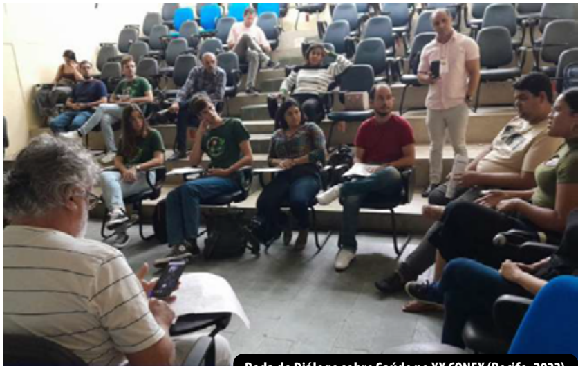
Roda de Diálogo sobre Saúde no XX CONEX (Recife, 2023)