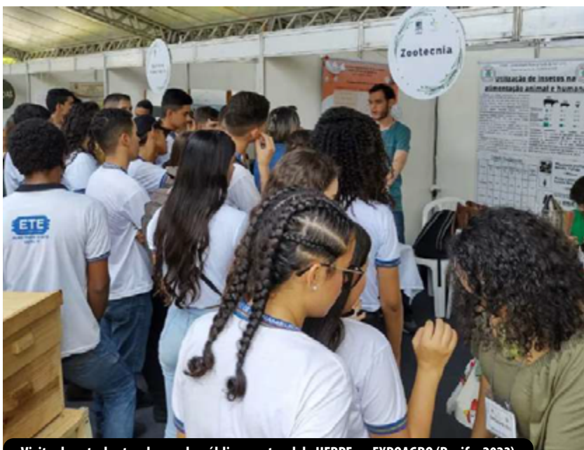
Visita de estudantes de escola pública ao stand da UFRPE na EXPOAGRO (Recife, 2023)