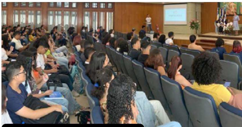
Aula inaugural no Salão Nobre da UFRPE (Recife, 2023)

Com esse trabalho, o PREPEX, por meio de aulas, palestras e outras atividades, oportuniza aos discentes o acesso aos conteúdos requeridos no ENEM e as informações fundamentais sobre o exame e sobre o ingresso em universidades, além de um suporte psicopedagógico. Até o ano de 2023, o PREPEX tinha contribuído com o ingresso, via Sistema de Seleção Unificada (SiSU), de mais de 250 estudantes em instituições de ensino superior (IES) públicas, visando a formação profissional e emprego no mundo do trabalho.