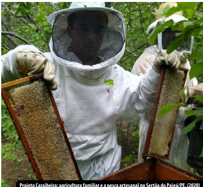
Projeto Caraibeira: agricultura familiar e a pesca artesanal no Sertão do Pajeú/PE, (2020)

Em 2020, como resposta à pandemia de COVID-19, a PROExC priorizou ações de prevenção e cuidados da saúde. O Edital BEXT/COVID-19, teve como finalidade desenvolver ações de extensão voltadas para o controle da transmissão do coronavírus. Neste mesmo ano, diante do contexto de crise sócio-econômica provocada pelo desemprego e a fome, foi lançado o Edital BEXT 05/2020 - Formação para Segurança e Soberania Alimentar, que se concentrou no fortalecimento dos Bancos Populares de Alimentos, integrando o Programa Mãos Solidárias, vinculado à arquidiocese de Olinda e Recife e ao Movimento dos Trabalhadores Sem Terra. Esse edital buscou ampliar processos educativos e organizativos relacionados ao direito universal à alimentação, à segurança e à soberania alimentar. O Edital BEXT 2020 teve sua continuidade garantida pela PROExC para anos 2021 e 2022.