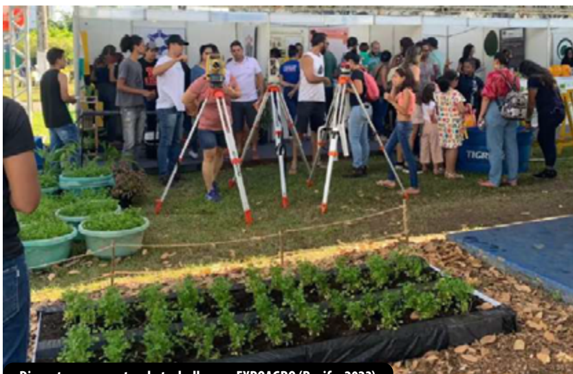
Discentes apresentando trabalhos na EXPOAGRO (Recife, 2023)