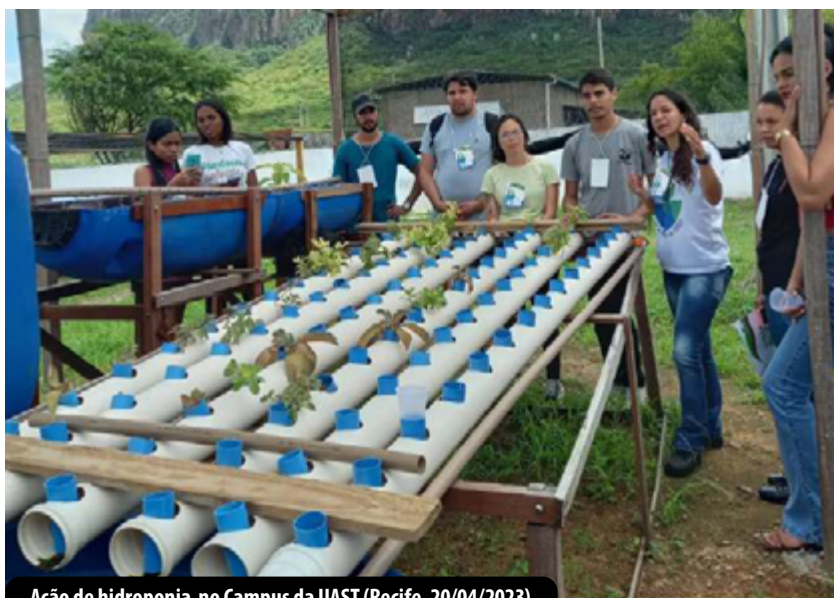
Ação de hidroponia no Campus da UAST (Recife, 20/04/2023)