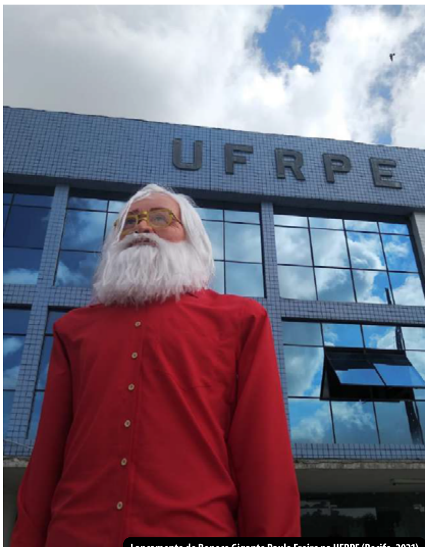
Lançamento do Boneco Gigante Paulo Freire na UFRPE (Recife, 2021)

Como ação de culminância da Jornada, foi realizado um ato político e cultural no centro da cidade do Recife, no dia 19 de setembro de 2021. A atividade foi organizada pelas entidades que compõem a Campanha Latino-Americana e Caribenha em Defesa do Legado de Paulo Freire, em parceria com universidades, instituições da sociedade civil e do estado.