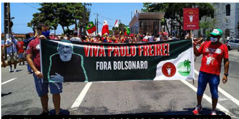
Ato político no centro do Recife no Centenário de Paulo Freire - (Brasil de Fato, 20.09.2021)