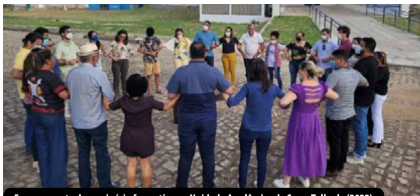
Encerramento do seminário formativo na Unidade Acadêmica de Serra Talhada (2022)

Este processo de mobilização e reflexão gerou um debate propositivo sobre currículo, extensão universitária, curricularização e sobre o histórico do ensino superior e sua função para a sociedade. A riqueza proporcionada pelos diálogos mobilizou a comunidade acadêmica e cumpriu um papel formativo importante sobre a inserção curricular para membros de coordenações de cursos, diretores de unidades acadêmicas, representantes NDE e CCD dos cursos de graduação da UFRPE.