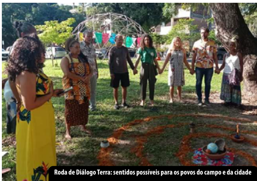
Roda de Diálogo Terra: sentidos possíveis para os povos do campo e da cidade (Recife, 17/04/2023)