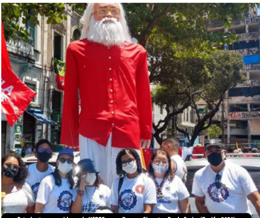
Estudantes e servidores da UFRPE com o Boneco Gigante - Paulo Freire (Recife, 2021)