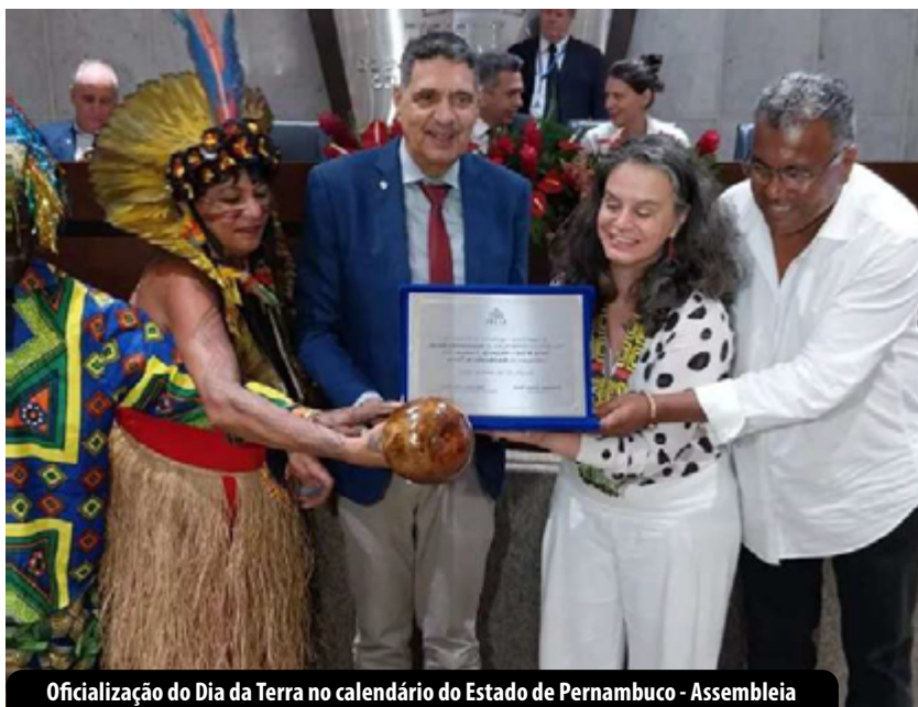
Oficialização do Dia da Terra no calendário do Estado de Pernambuco - Assembleia Legislativa de Pernambuco (Recife, /2023)